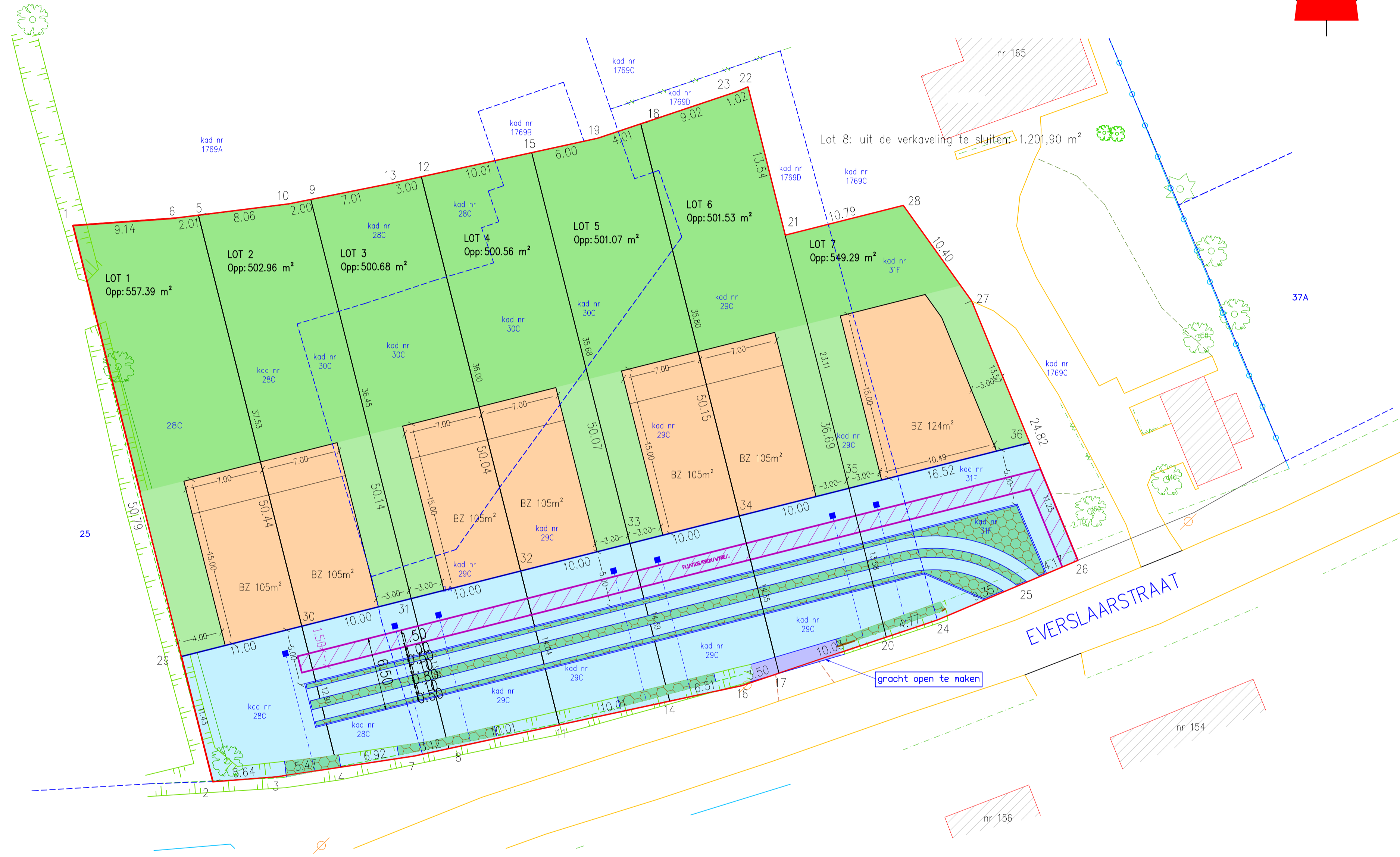
Coördinaten - Lambert 72